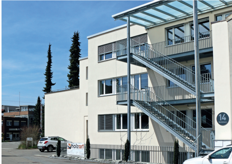
OfficeCare: Hier entstehen Ideen für eine rationellere Office-Automatisierung.

sind Herausforderungen, denen sich das OfficeCare Team erfolgreich stellt. Seit bald 40 Jahren (officeatwork 25, OfficeCare 15) bieten die beiden Firmen zusammen den Kunden massgeschneiderte Lösungen zur effizienten, einheitlichen und unternehmens- sowie behördenübergreifenden Dokumentenerstellung und Vorlagenverwaltung an. Dabei darf die Kundschaft beider Unternehmen auf langjährige Erfahrung, globale Partner-Netzwerke und fundierte Kenntnisse zählen.